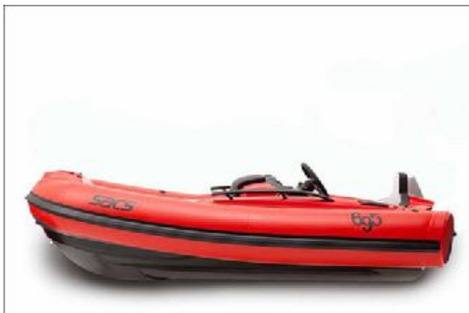
「Rosso Corsa」紅色艇身，搭配黑色線條，SACS-Abarth 695 Tribute Ferrari猶如橡皮艇版的Abarth 695 Tribute Ferrari。

採取橡皮艇設計的SACS-Abarth 695 Tribute Ferrari就如同Abarth 695 Tribute Ferrari的體型一般迷你，能夠作為大型遊艇與岸邊的接駁之用。外型上，雖然仍是一般的橡皮艇構型，但是在整體設計風格，明顯地向Abarth 695 Tribute Ferrari學習，雖然並不是以「Scuderia Red」紅色為船體顏色，但仍然採用了同樣熱血的「Rosso Corsa」紅色作為底色，搭配黑色滾邊與「695」字樣，彷彿就是橡皮艇版的Abarth 695 Tribute Ferrari。