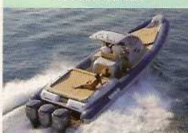
Heaven 40 WA