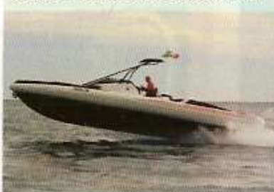
Sacs Powershore Abarth SP